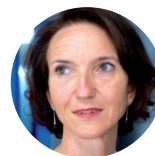
Florence Reuzeau Airbus

renforcé par l'expertise de représentants des organisations partenaires de la Foncsi, ce qui permet un traitement multisectoriel de la question (industries, autorités de contrôle et instituts des domaines de l'énergie, du nucléaire, des transports aériens et ferroviaires).