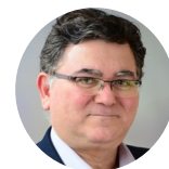
Stéphane Corcos DGAC